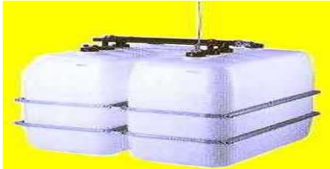
Batterietanks aus Kunststoff

Kunststoffbehälter sind werksmäßig hergestellte Einzelbehälter, die zu einer Batterie zusammengestellt werden dürfen. Batteriebehälter sind im Auffangraum aufzustellen. Eine Ausnahme gibt es für glasfaserverstärkte Kunststoffbehälter (GFK) bis maximal 2 m 3 Inhalt.